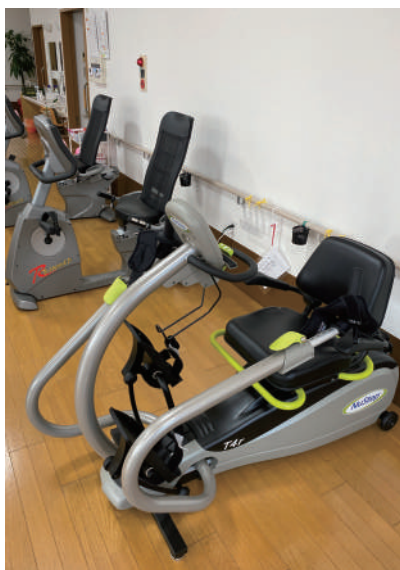
▲有酸素運動用マシン