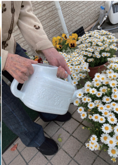
▲ご入居者様の日課