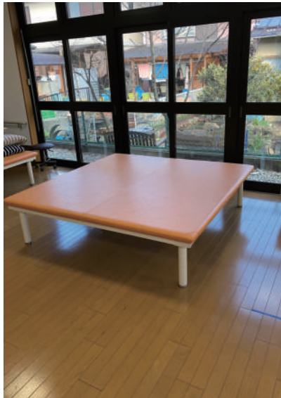
▲理学療法士による個別機能訓練