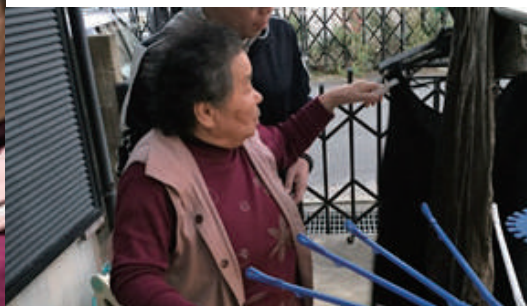
通所リハビリテーション