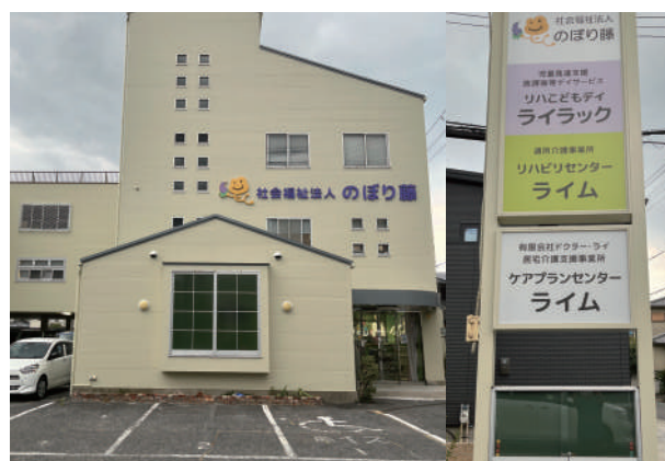
リハこどもデイ ライラック / リハビリセンター ライム