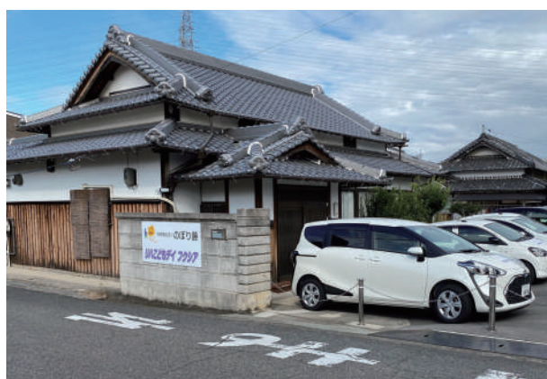
リハこどもデイフクシア