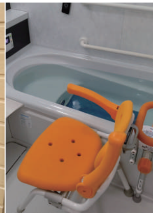
▲身体介護 / 入浴介助