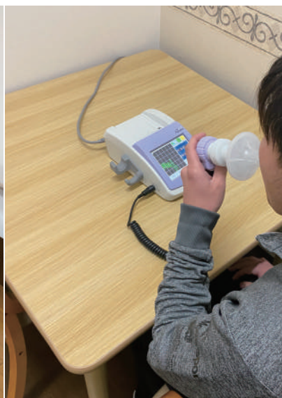
▲スパイロメーターでの評価