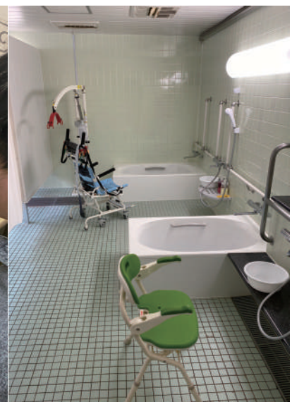
▲浴室（個浴 3・リフト浴 1）