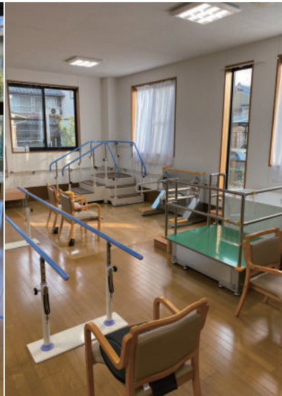
▲サーキットトレーニング